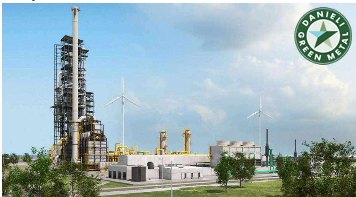
Danieli & C. Officine Meccaniche S.p.A.

Si ribadisce che la decarbonizzazione della produzione dell'acciaio è un processo avviato a livello mondiale, la Danieli si obietta a dare attivamente il proprio apporto offrendo soluzioni tecnologiche innovative per la produzione di Green Steel con bassissime o nulle emissioni di CO2. Nei prossimi decenni si necessiterà di un forte impegno tecnologico ed economico a carico di tutta la catena del valore per raggiungere le traiettorie richieste dall'Accordo di Parigi ed oggi ribadite dal COP26 di Glasgow. Uno degli obiettivi strategici della Danieli è quello di identificare spazi e opportunità di azione non solo per mantenere solido il valore degli asset propri e quelli dei suoi clienti ma anche garantendo dei ritorni futuri, sviluppando soluzioni tecnologiche innovative con un contributo concreto verso la Race to Zero delle emissioni.