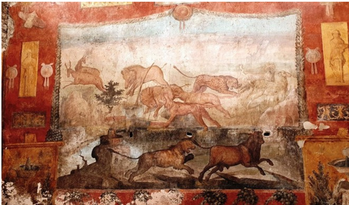
Ref. account Instagram prof. Massimo Osanna

A livello geografico , la crescita ha interessato i Paesi extra europei (5,64%). In particolare il Giappone dove il Covid ha avuto un impatto meno incisivo e la filiale Withus ha segnato un record di fatturato; la Cina dove l'attività del settore taglio ha mantenuto ritmi record nel secondo semestre; e gli Usa dove i distributori nel settore medicale hanno ben resistito a condizioni ambientali molto avverse per la maggior parte dell'anno.